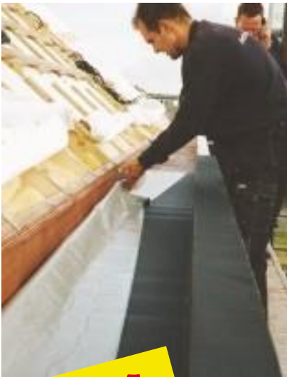
Het kleven van EPDM rubber